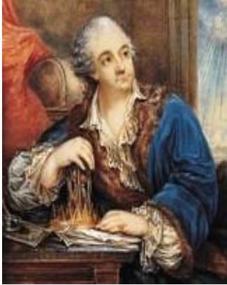
Stanisław August Poniatowski

Głównymi autorami Konstytucji 3 maja byli: król Stanisław August Poniatowski , Ignacy Potocki i Hugo Kollątaj .